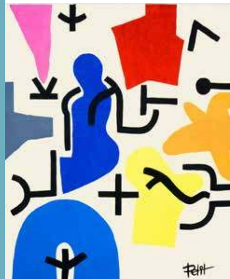
Jean Pierre Petit. 2025. Joie écarlate I. Acrylique sur toile de lin marouflée, 84 x 73.5 cm

À la chapelle St-Marc à Trévenec les 25 et 26 avril de 10h à 18h et les après-midis des 27 et 28 avril de 14h à 18h