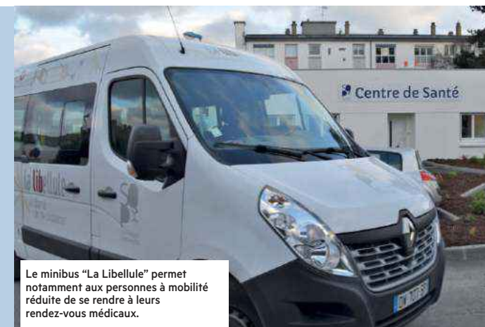
Le minibus "La Libellule" permet notamment aux personnes à mobilité réduite de se rendre à leurs rendez-vous médicaux.

www.saintbrieuc-armor-agglo.bzh, rubrique "vivre et habiter", page "gérer et réduire nos déchets".