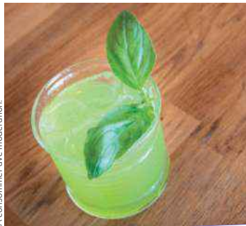
L'abus d'alcool est dangereux pour la santé. À consommer avec modération.