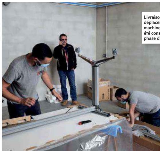
Livraison du mobilier, déplacement des machines... Début juillet a été consacré à la première phase d'emménagement.

Après 40 ans de bons et loyaux services, le site de l'ancienne gare rue Duguesclin sera donc libéré à la rentrée, laissant la place pour un futur projet de logements. ▲