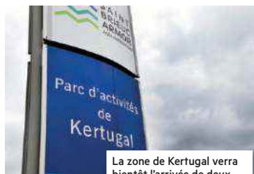
La zone de Kertugal verra bientôt l'arrivée de deux nouvelles activités.