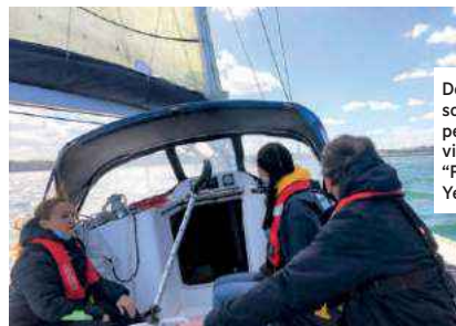
Début mai, lors d'une sortie avec des personnes déficientes visuelles et l'association "Faisons Avec Nos Yeux".

Participer sur projets.solidaritegrandouest.fr ou via le site snsqp.com @SNSaintQuayPortrieux