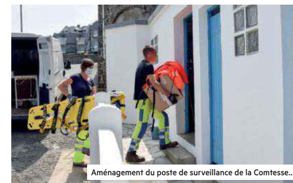
Aménagement du poste de surveillance de la Comtesse...

"Chaque printemps, nous programmons aussi des opérations d'entretien qui visent à préserver le patrimoine communal. Cette année, les maçons ont repris le jointoiment du mur de soutènement au-dessus de la plage de la Comtesse, les peintres se sont chargés des barrières et garde-corps de la plage du Châtelet et le menuisier a fabriqué de nouvelles portes pour les cabines de la plage du Casino". ▲