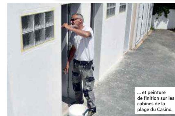
... et peinture de finition sur les cabines de la plage du Casino.