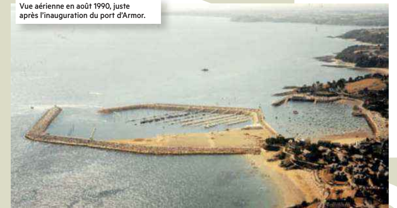
Vue aérienne en août 1990, juste après l'inauguration du port d'Armor.

À la fin des années 80, la construction du port en eaux profondes est l'autre fait marquant du parcours de Pierre. "La SPADA, chargée de la construction du port d'Armor, m'a missionné pour suivre le chantier en images. C'est un grand souvenir d'assister ainsi à la naissance d'un équipement qui a bouleversé l'histoire de la commune".