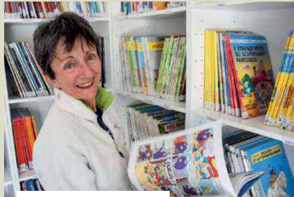
Le rayon BD-Jeunesse de la Bibliothèque est particulièrement prisé.