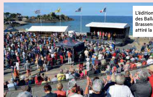
L'édition 2019 des Ballades avec Brassens avait attiré la foule.

Georges Brassens aurait eu 100 ans cette année. Pour célébrer la mémoire de l'immense auteur-compositeur, trois communes s'associent pour proposer un programme d'animations. Du 6 au 12 août, l'exposition "Un instant avec Brassens" est organisée à la Maison de la Mer de Lézardrieux. À Lanmodez, un festival sur trois jours (6, 7 et 8 août) associera les œuvres du chanteur à celles du poète Jean de La Fontaine. Et les 17, 18 et 19 septembre, les "Ballades avec Brassens" reviendront pour une seconde édition à Saint-Quay-Portrieux. Avec apéro-concert au Casino le vendredi; concerts d'Elsa Carolan puis du groupe "La Mauvaise Réputation" au Centre de Congrès le samedi soir; et le dimanche après-midi, quatre scènes ouvertes aux abords de la plage du Casino avec plus de 70 groupes présents. ▲