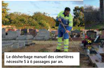
Le désherbage manuel des cimetières nécessite 5 à 6 passages par an.

Opération élagage avenue du Martouret : les branchages deviendront du paillage pour la commune.