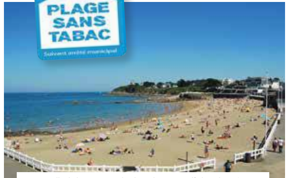
Comme celle de la Comtesse, la plage du Casino affichera bientôt la signalétique "sans tabac". Des panneaux financés pour moitié par la Ligue contre le cancer.

L'ensemble du dispositif fera l'objet d'une évaluation régulière mais la ville compte avant tout sur le respect et le comportement citoyen de chacun. ▲