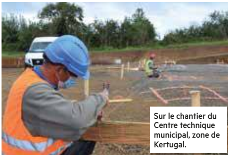
Sur le chantier du Centre technique municipal, zone de Kertugal.

Afin d'accompagner et de soutenir l'activité économique, et particulièrement celle des entreprises de travaux publics et des artisans du bâtiment, la commune a décidé d'autoriser exceptionnellement la poursuite des chantiers durant la période estivale. Une dérogation aux dispositions habituelles qui permettra notamment de poursuivre les programmes de la station d'épuration ou du centre technique municipal. Pour limiter au maximum les nuisances sonores, il est demandé aux professionnels de limiter leurs activités du lundi au vendredi, de 9h à 12h et de 13h30 à 18h30.