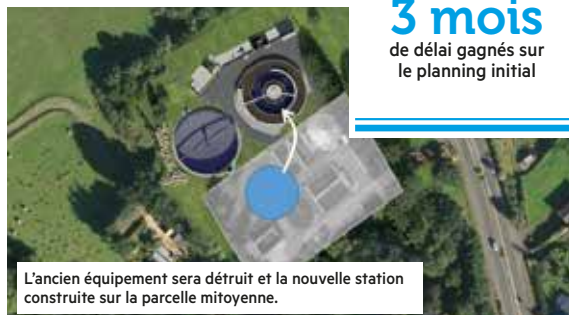
L'ancien équipement sera détruit et la nouvelle station construite sur la parcelle mitoyenne.

Pour rappel, la compétence "assainissement" a été transférée à Saint-Brieuc Armor Agglomération au 1 er janvier 2019. Sur la base de l'avant-projet édité par la Direction des services techniques de Saint-Quay-Portrieux,