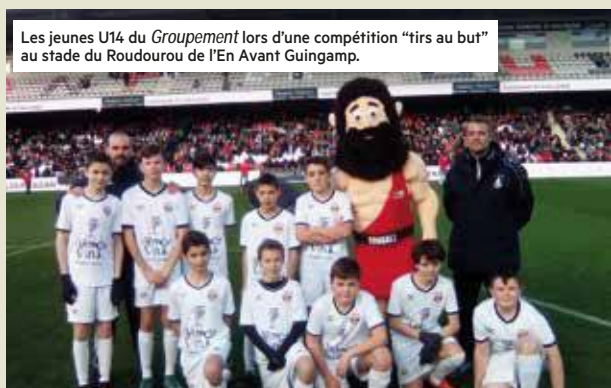
Les jeunes U14 du Groupelement lors d'une compétition "tirs au but" au stade du Roudourou de l'En Avant Guingamp.

Les entraînements du Groupelement des Jeunes du Sud Goëlo ont pu reprendre cet été. De 5 à 18 ans, féminines et en futsal : dans toutes les sections, le club accueille les plus jeunes à bras ouverts !