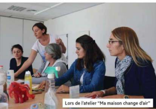
Lors de l'atelier "Ma maison change d'air"

L e 26 septembre dernier, au Centre de Congrès de Saint-Quay-Portrieux, le Relais Parents Assistants Maternels (RPAM) de l'Agglomération organisait une journée visant à informer les familles et accompagner les professionnels de la petite enfance. Grâce au concours de plusieurs partenaires (Mutualité Française, Croix Rouge, Conseil départemental, Prévention Routière, Police municipale quincocéenne...), plusieurs stands et ateliers ont sensibilisé le public à la prévention des risques au quotidien.