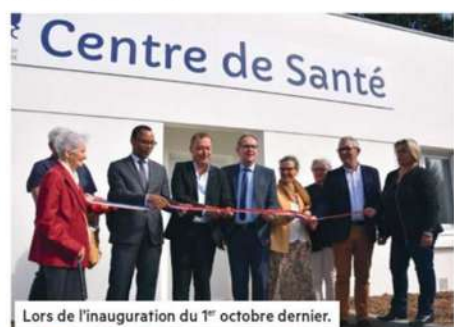
Lors de l'inauguration du 1 er octobre dernier.

modèle mis en place début octobre, les premiers indicateurs révèlent tout de même un réel besoin chez les usagers. En deux semaines, près de 200 personnes ont ainsi choisi le Centre de santé en tant que “médecin référent”. Majoritairement Quincocéens, les patients viennent aussi de Plérin, Châtelaudren ou encore Plouha.