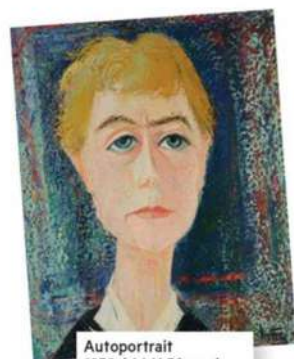
Autoprotail 1958 / 64 X 50 cm / Collection privée.