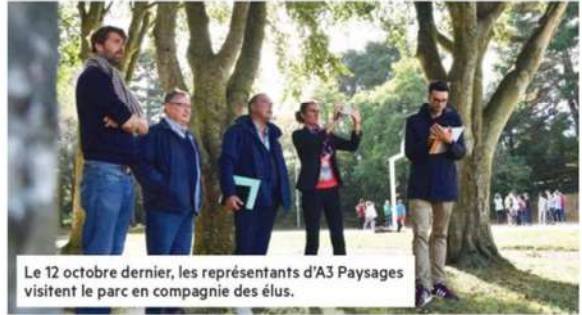
Le 12 octobre dernier, les représentants d'A3 Paysages visitent le parc en compagnie des élus.

La méthode retenue prévoit d'associer les habitants à l'élaboration du projet. Les premiers rendez-vous, destinés à recueillir les attentes et à partager les idées, sont d'ailleurs d'ores et déjà programmés (voir ci-contre).