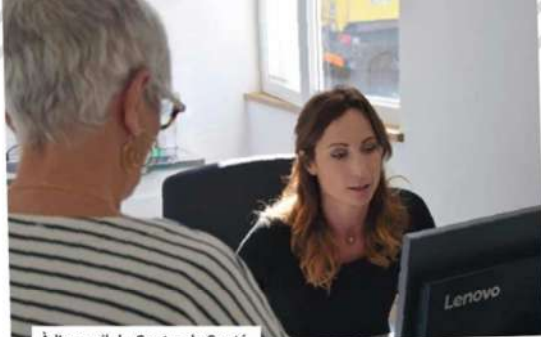
À l'accueil du Centre de Santé.

En janvier 2019, les consultations s'étendront de 8h à 20h en semaine et de 9h à 12h le samedi.