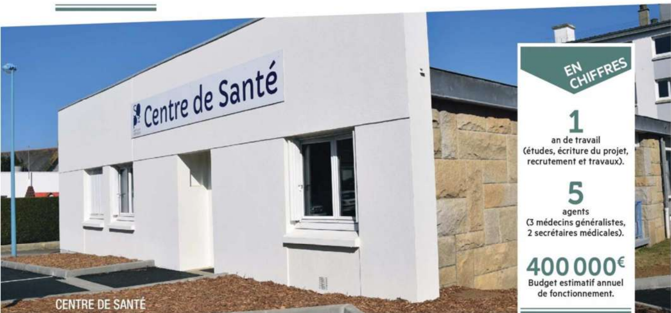
CENTRE DE SANTÉ