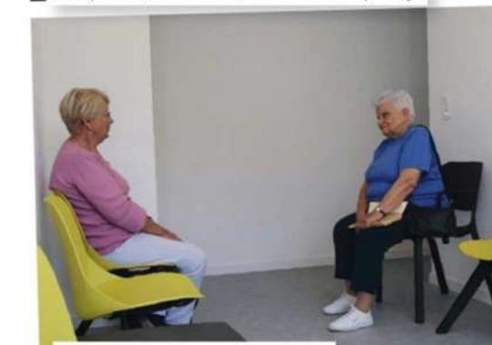
Les locaux ont été totalement réhabilités.