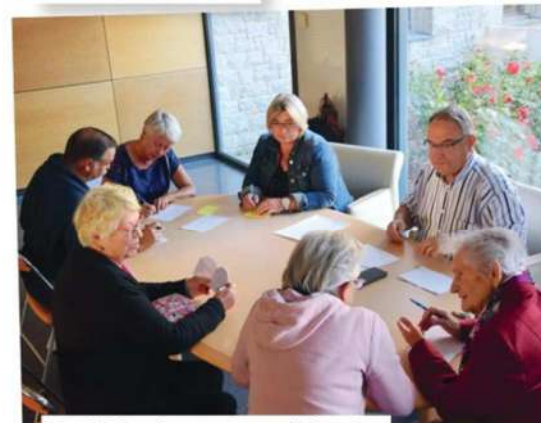
En mairie, lors d'une permanence d'information.