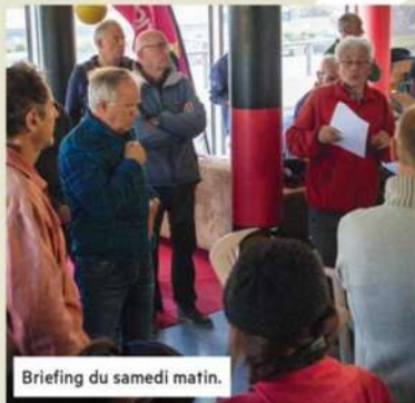
Briefing du samedi matin.

Mais le SNSQP ne s'arrête pas à cette seule pratique. "Nous proposons également la Voile au large, sur le JOD 35 que nous avons réhabilité, pour une pratique plus sportive. Les membres inscrits sont susceptibles de participer à des régates".