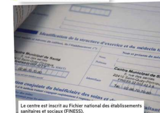
Le centre est inscrit au Fichier national des établissements sanitaires et sociaux (FINESS).