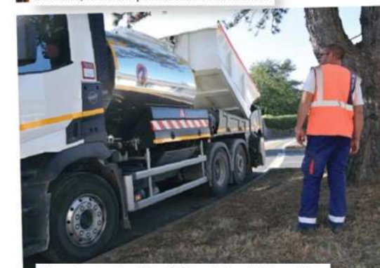
Fin septembre, dernières finitions de l'enrobé du parking.